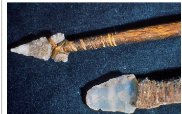
Befestigung einer Spitze und Klinge am Schaft