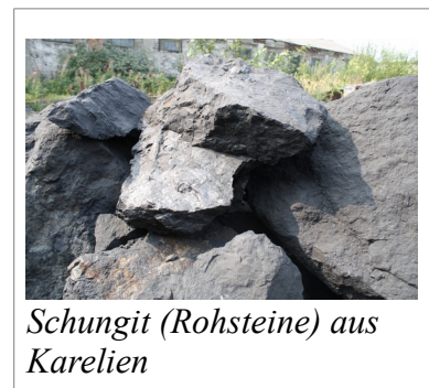
Shungit (Rohsteine) aus Karelien