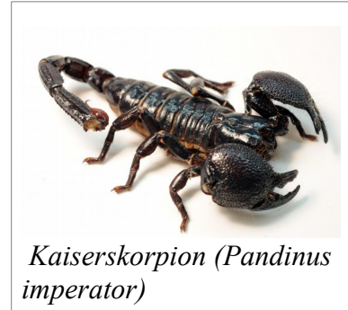
Kaiserskorpion (Pandinus imperator)

Die Skorpione gehören zu den Spinnentieren (Arachnida). Weltweit sind etwa 1400 Arten bekannt. Skorpione erreichen Körpergrößen zwischen 9 Millimetern und 21 Zentimetern. Sie leben vorwiegend in sandigen oder steinigen Böden oder in Bodennähe der Tropen und Subtropen, Wüsten und Halbwüsten. Wenige Arten sind kletternde Baumbewohner, Wanderer oder Höhlenbewohner und halten sich als Kulturfolger in der Nähe menschlicher Behausungen auf. Es gibt nur eine geringe Anzahl von Arten, deren Stich für den Menschen tödlich sein kann.