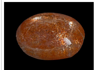
Sonnenstein aus Indien