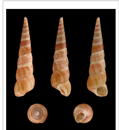
Gemeine Turmschnecke ( Turritella communis )

Fossilien von Turritella finden sich in Mitteleuropa seit der Kreidezeit (vor 145 Millionen Jahren). Vorläuferformen gab es schon im Devon (ca vor 400 Millionen Jahren). Die Gattung brachte besonders im Känozoikum (in den letzten 66 Millionen Jahren) zahlreiche Arten hervor.