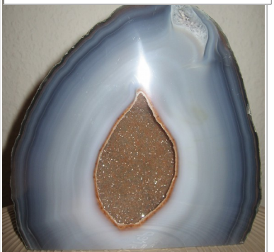
Achate als Ausfüllung eines Gesteinshohlraumes